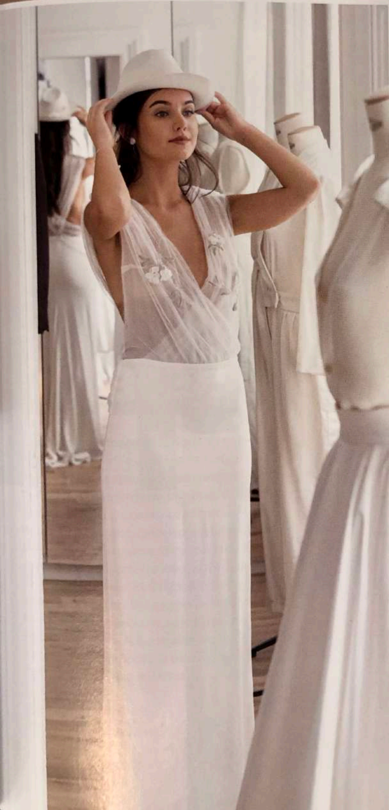
X photo à gauche,

Robe «Douce», en crêpe de soie et tulle plissé rehaussé de fleurs brodées au fil, 3 200€ sur mesure et made in Paris. Chapeau, Love is Like a Rose.