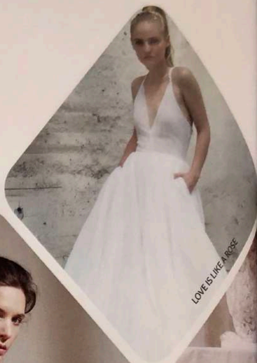
LOVE IS LIKE A ROSE